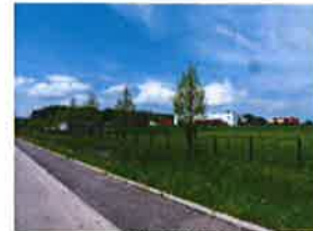
Zone activités Rioz

Une part d'emplois industriels de 20% (notamment microtechniques et métallurgie de précision), contre 13% au niveau national