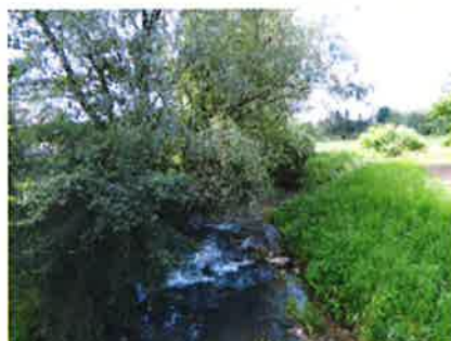
La Tounolle, Boulot