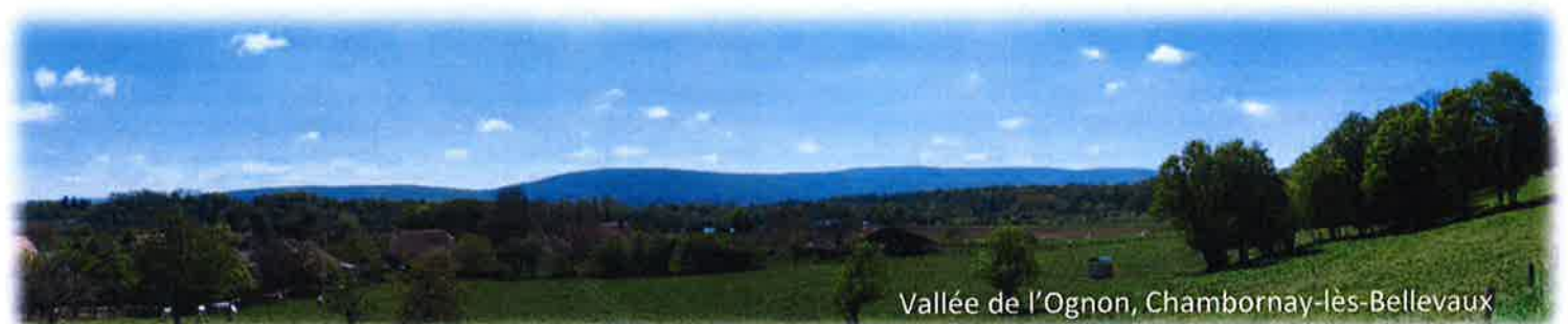
Vallée de l'Ognon, Chambornay-lès-Belleaux

Des cours d'eau et des masses d'eau souterraines à protéger pour les générations futures