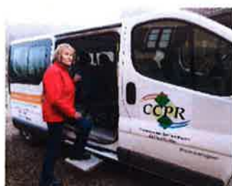
Transport à la demande